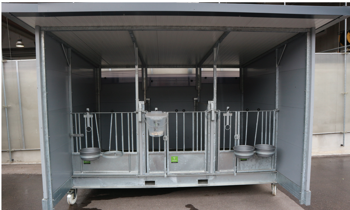
TopCalf Triokälberbox auf Rädern