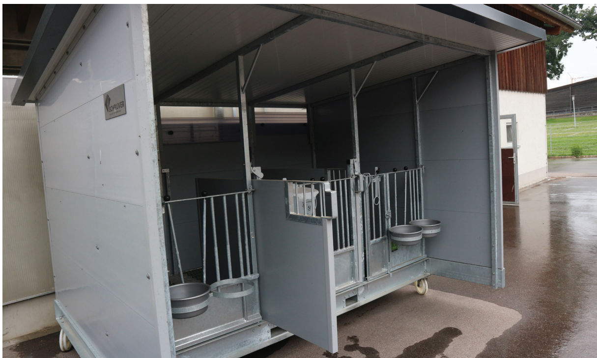
TopCalf Triokälberbox auf Rädern